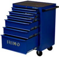
Carro con 6 cajones de 26" 9066K6