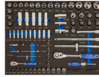
Dados y puntas en foam 3/3 (94 piezas) IFF1A001