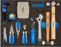
Herramientas de golpeo, pinzas y puntas en foam 3/3 (85 piezas) IFF1A002