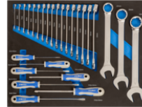
Llaves combinadas y destornilladores en foam 3/3 (27 piezas) IFF1A003